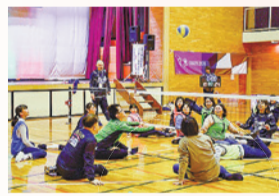
シットイングバレーボール