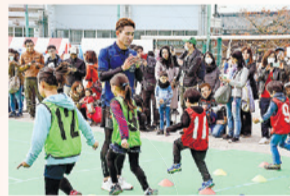
アスリートの走り方教室

12月1日(日)、落合第二中学校・落合第三小学校でアスリートによるスポーツプログラムのほか、区の伝統工芸「染色」の体験やダンス等のステージイベントなどを開催し、多くの参加者でにぎわいました。