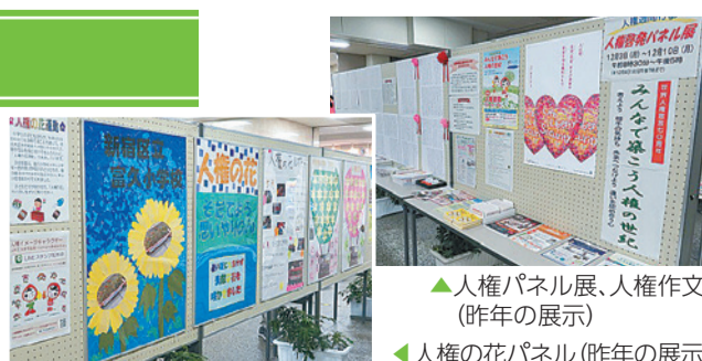
▲人権パネル展、人権作文(昨年の展示) ▼人権の花パネル(昨年の展示)