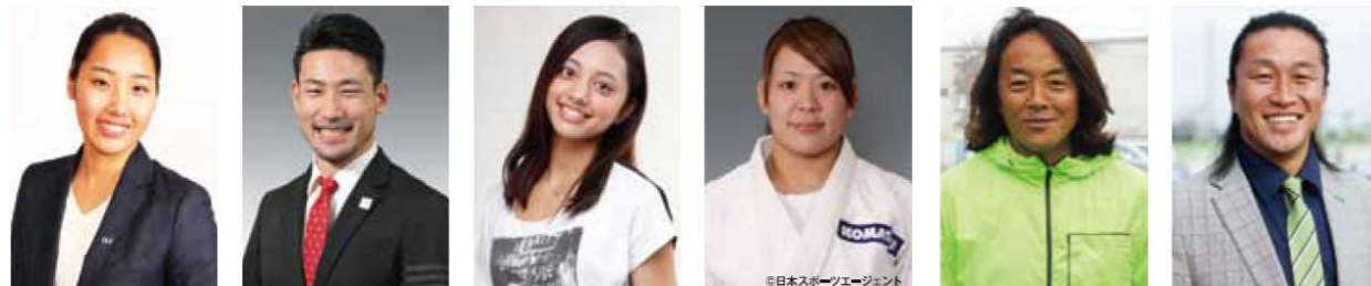
三井梨紗子さん アーティスティックスイミング ロンドン2012オリンピック出場 リオデジャネイロ2016オリンピック 銅メダリスト 塚原 直貴さん 陸上短距離 北京2008オリンピック 4x100mリレー銀メダリスト サイド横田仁奈さん 新体操 ロンドン2012オリンピック出場 谷本 歩実さん 柔道 アテネ2004オリンピック金メダリスト 北京2008オリンピック金メダリスト 北澤 豪さん サッカー元日本代表 岡野 雅行さん サッカー元日本代表

本イベントでは、区が実施する東京 2020 大会の気運醸成イベントをサポートするため、区独自ボランティア制度に登録した【新宿 2020 サポーター】が、活躍します! (活動内容: イベント会場での運営補助および会場整理)