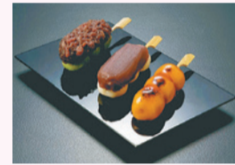
追分だんご本舗 の各種だんご