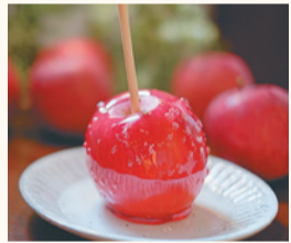
ポムダムールトーキョーの りんご飴