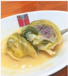
東京アカシアのロール キャベツシチュー