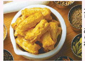
新宿中村屋の カリール