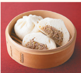
神楽坂五〇番総本店の 肉まん