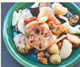
神楽坂プリュスのあられ