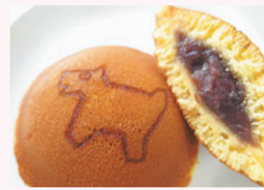
文明堂東京・新宿 観光振興協会の しんじゅく丸どらやき

新宿を代表する老舗の商品や、友好提携都市「伊那市」の特産品を販売します。また、新宿の観光情報を配布するほか、映像や写真で区の観光情報を発信します。