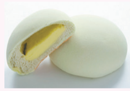
新宿高野の クリーム メロンパン