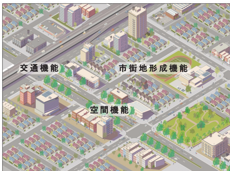
図 3-50 都市計画道路が有する機能