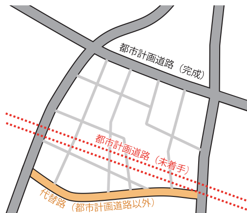
図 3-49 既存道路による代替のイメージ (代替路)

未着手の地域的な都市計画道路の近傍に、都市計画道路が有する機能を代替できる都市計画道路以外の道路がある可能性があります。