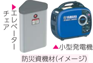
防災資機材(イメージ)

【申込み】7月18日(木)から所定の申請書を危機管理課地域防災係(〒160-8484歌舞伎町1-4-1、本庁舎4階)☎(5273)3874・FAX(3209)4069へ郵送またはお持ちください。申請書は、新宿区ホームページから取り出せます。