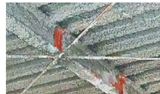
梁やデッキに付着したアスベスト

繊維状の天然鉱物で、耐熱性・耐久性に優れていることから、断熱材・保温材等の建築材料、電気製品、自動車、家庭用品等さまざまな用途で使われていましたが、平成18年以降使用が禁止されました。アスベスト繊維は目に見えないくらい細く軽いため、空気中に飛散しやすく、人が吸入すると「肺線維症(じん肺)」「悪性中皮腫」「肺がん」を引き起こす可能性があり、アスベストの劣化・損傷や建物の解体工事によるアスベストの飛散などにより、アスベストを吸い込むことで起こる健康被害が問題となっています。