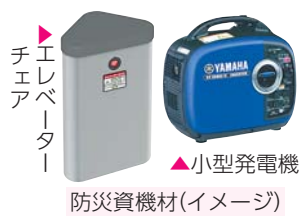
エレベーター ▲小型発電機 防災資機材(イメージ)

【申込み】7月18日(木)から所定の申請書を危機管理課地域防災係(〒160-8484歌舞伎町1-4-1、本庁舎4階)☎(5273)3874・FAX(3209)4069へ郵送またはお持ちください。申請書は、新宿区ホームページから取り出せます。