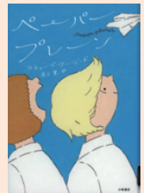
『ペーパープレーン』