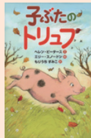
『子ぶたのトリュフ』

ヘレン・ピーターズ/作 エリー・スノードン/画 もりうちすみこ/訳 (さ・え・ら書房)