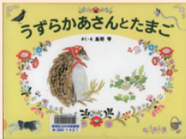
『うずらかあさんとたまご』