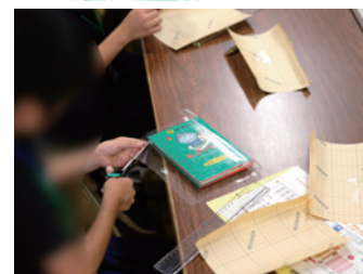
▲ブックカバー(保護フィルム)を本に貼る様子

スタッフから図書館の仕事を伝授！1日だけ図書館員となり、館内図書の本の整理やブックカバーかけといった図書館の仕事を経験しました。