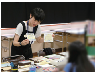
▲スタッフが上手なPOPの作り方を説明

お気に入りの本を文章やイラストで紹介するPOP(商品にそえる広告)をつくりました。つくったPOPは、後日こども図書館で展示されました。