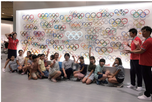
▲制作したウェルカムボードと子どもたち