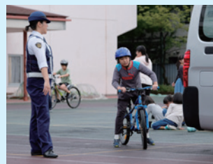
▲車の後ろから安全確認