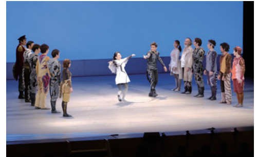
▲上演後のカーテンコールの様子

7月5日の公演は、同劇団等が事業を始めて通算5,000回目となる節目の上演回となりました。オリジナルファミリーミュージカル『カモメに飛ぶことを教えた猫』は劇団四季の26年ぶりの新作で、「殻をやぶり、勇気を出して一步踏み出すことの大切さ」をテーマに、登場人物の心の成長を描いたものです。観劇中、児童は真剣な表情で見入っていました。上演後は会場が拍手に包まれ、児童の一人は「ストーリーに感動しました。迫力があり自分も劇の中に入っていきようでした」と話してくれました。