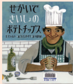
『せかいでさいしょのポテトチップス』