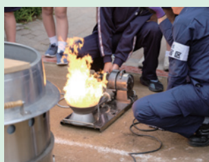
▲バーナー点火訓練

9月14日(土)、西早稲田中学校では1年生が地域の町会や消防署・消防団の方々、区危機管理課等の職員と一緒に、避難所防災訓練を行いました。実践的な指導のもと、三角巾やAEDを使った応急救護訓練や、炊き出しなどに使用するバーナーを点火する訓練等を行い、身近に起こりうる災害への対応力を身に付けました。