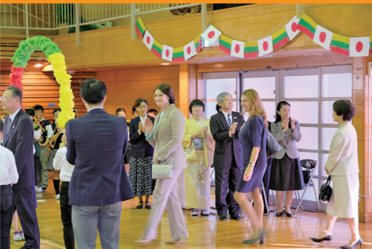
▲リトアニア国旗や国旗色のアーチでお迎えしました