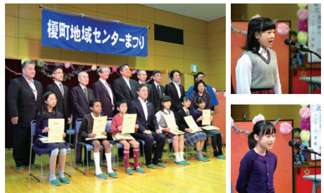
▲表彰式では5・6年生の最優秀賞受賞者が暗唱を披露 (10月27日 榎町地域センターまつり)

6回目の開催となったこの日、江戸川小学校・早稲田小学校・鶴巻小学校・牛込仲之小学校の5・6年生が参加し、「坊っちゃん」と「吾輩は猫である」の一部を、いきいきと臨場感のあふれる暗唱で発表しました。