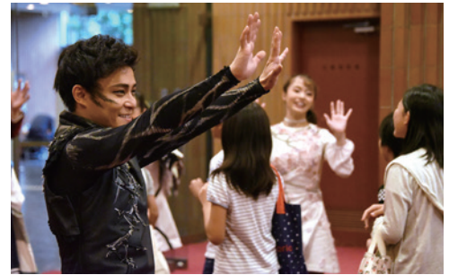
▲出演者の方々からのお見送り