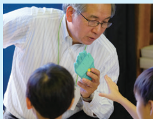
▲潰れた粘土にびっくり

自転車教室では、児童が自転車で通行する実技を行いました。交差点や踏切、駐車車両などが配置されたコースを進みながら、戸塚警察署の方々から、一時停止や周囲の安全確認をどのような場所で行えばよいかを学びました。