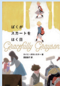
『ぼくがスカートをはく日』

エイミ・ボロンスキー/著 にしだまよこ 西田佳子/訳 まめふく/絵 (学研プラス)