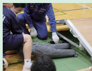
▲家屋倒壊救出訓練