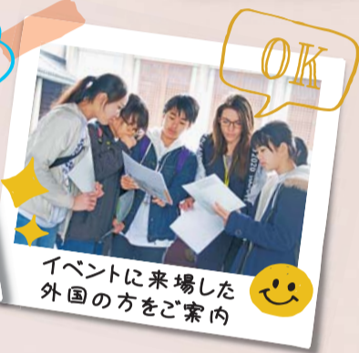
イベントに来場した外国の方をご案内