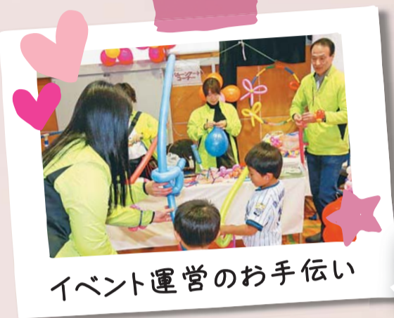
イベント運営のお手伝い

聴覚に障害がある方で「ファックス番号のない記事」へのお問い合わせは、しんじゅくコールのファックスをご利用ください。