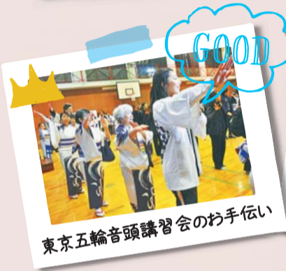
東京五輪音頭講習会のお手伝い