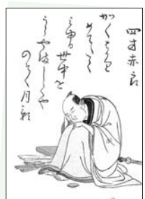
大田南畝「古今狂歌集」

蜀山人(しよくさんじん)の号でも知られる大田南畝(なんぼ)は、狂歌師・戯作者・幕府御家人などさまざまな顔を持つ江戸時代の文人です。今回は、肖像画や直筆の随筆のほか、ゆかりの漢詩・文集・文人画などの資料から、南畝の生涯と文芸世界を探ります。 【日時】10月15日(日)～12月4日(日)午前9時30分～午後5時30分(金曜日は午後8時まで)。 入館は各30分前まで。10月24日(日)、11月14日(日)・28日(日)は休館。 【費用】300円(常設展とのセット券は500円)・団体割引(20名以上)は1名50円。中学生以下は無料。 【会場】問合せ 新宿歴史博物館(三栄町22) ☎ (3359) 2131へ。