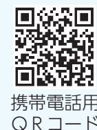
携帯電話用QRコード

新宿区選挙管理委員会公式ツイッターでは、新宿区議会議員選挙に関する情報を随時配信しています。ぜひご活用ください。 アカウント名:shinjuku_senkan(新宿区選挙管理委員会) URL:https://twitter.com/shinjuku_senkan