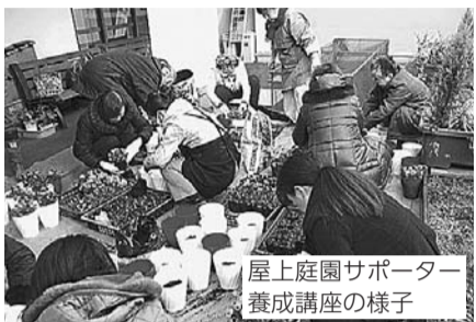
屋上庭園サポーター養成講座の様子

または直接、同館(市谷薬王寺町51)☎(3353)2333へ。応募者多数の場合は抽選。