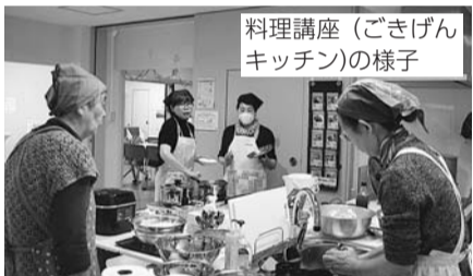
料理講座(ごきげんキッチン)の様子

※④～⑥は当日、400円をお支払いください。エプロン・三角布をお持ちの上、爪を切っておいでください。