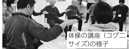
体操の講座 (コソニサイズ)の様子