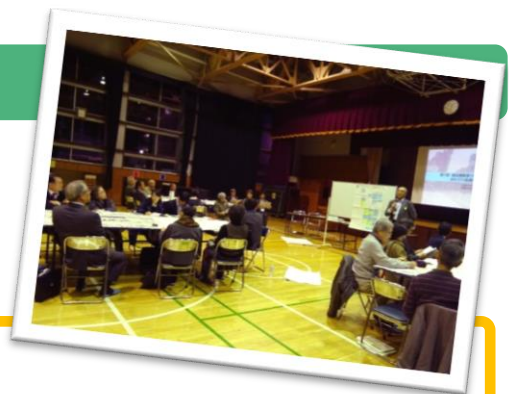
■大久保通りの様子

第7回まちづくり協議会は、昨年11月30日（金）に津久戸小学校の体育館で開催し、40名の方にご参加いただきました。当日は、分科会に分かれて「まちづくり構想（案）」やアンケート調査について意見交換しました。