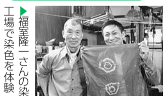
工場で染色を体験

地域の多彩な魅力を紹介する区の広報番組です。2月は、無地染のマイスターのほか、落合・中井地域を染物で彩るイベント「染の小道2019」を紹介します。