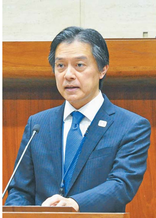
所信を表明する吉住区長

11月26日、平成30年第4回新宿区議会定例会の開会にあたり、吉住健一区長は、2期目の区長就任にあたっての所信を表明しました。今回は、その概要をお知らせします。所信表明の全文は、新宿区ホームページでご覧いただけます。 【問合せ】企画政策課(本庁舎3階) ☎(527)3502・☎(5272)5500へ。