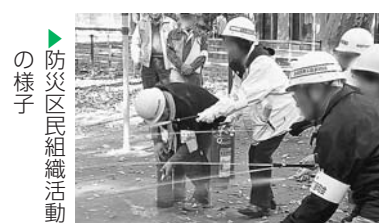
▶防災区民組織活動の様子