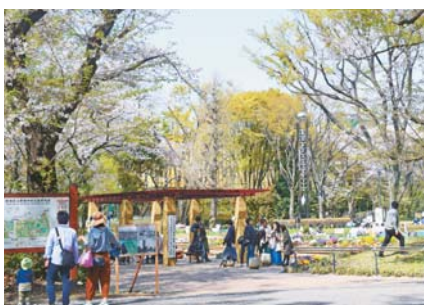
▲開園50周年を迎えた新宿中央公園

このため、新宿駅周辺地域の整備など、地域の特性を活かしたまちづくりを推進するとともに、ユニバーサルデザインのまちづくり、道路・交通環境の整備、豊かなみどりの創造と魅力ある公園等の整備、地球温暖化対策などに取り組めます。また、まちの歴史や記憶、文化、芸術など多様な魅力による賑わいの創造、国際観光都市・新宿としての魅力の向上、生涯にわたり学習・スポーツ活動などを楽しむ環境の充実などに取り組めます。