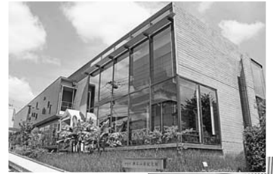
▲漱石山房記念館から文化を発信