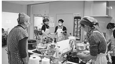
▲地域支え合い活動の拠点・ささえーる薬王寺での活動