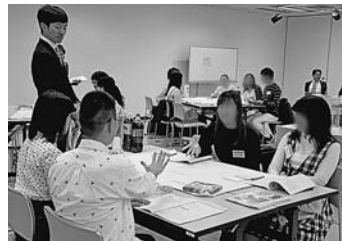
▲若者会議での議論の様子