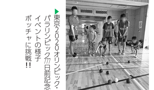
▶東京2020オリンピック・パラリンピック7月17日前記念イベントの様子 ▶ポッチャに挑戦!!