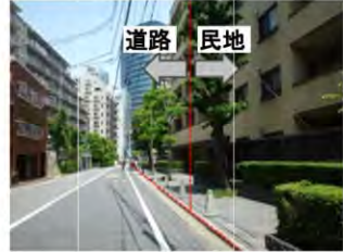
開発による壁面後退で、歩道状空地を確保した例