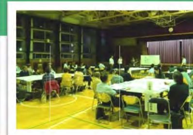
← 第6回協議会の様子