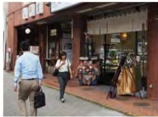
壁面を後退させて、看板を設置している例