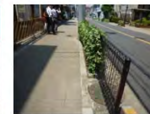
植樹帯をコンパクトにしている例