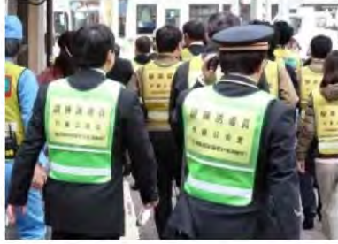
JR荻窪駅前で、交通機関や地元が一体となって実施している滞留者対策訓練