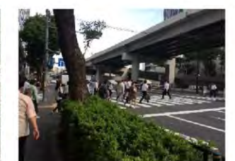
後楽園方面へ行く歩行者が多い