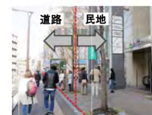
壁面後退により歩行空間を確保した例