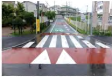
ロードペイントにより、一時停止を促す例