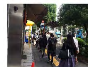
朝の時間帯は多くの通勤者で溢れている