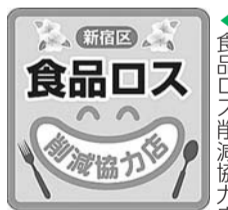
▲食品ロス削減協力店ロゴ