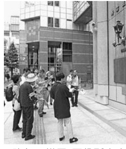
▲昨年の様子(区役所本庁舎正面玄関前の平和の灯)

【日時・集合場所】11月4日(日)午後1時30分から(午後1時30分に都営大江戸線牛込柳町駅東口の地下からの出口前に集合)。戸山シニア活動館で懇談後、午後4時解散予定(雨天中止)