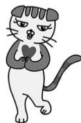
▲しんじゅく健康フレンズ「こころ」

詳しくは、▶牛込、▶四谷、▶東新宿、▶落合の各保健センターへお問い合わせください。