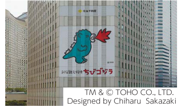
TM & © TOHO CO., LTD. Designed by Chiharu Sakazaki

【問合せ】新宿クリエイターズ・フェスタ実行委員会事務局(第1分庁舎7階、文化観光課にぎわい創出等担当内) ☎(5273)4220・FAX(5273)3931へ。