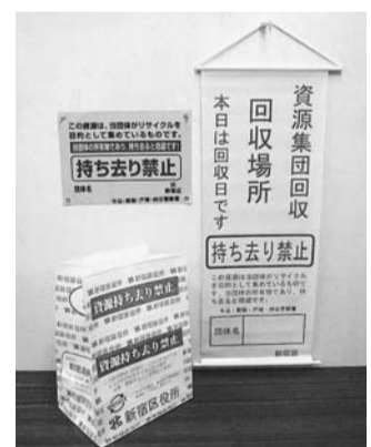
配布している標識旗、持ち去り禁止シート、持ち去り禁止袋