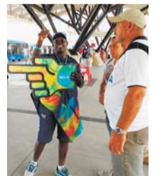
▲リオ大会の会場を案内するボランティア

【対象】区内在住・在勤・在学の方ほか、150名 ※都市ボランティアに応募可能な方に限ります。 【受付期間・会場・申込み】10月23日(火)~11月6日(火)の平日午前9時~午後5時(火曜日は午後7時まで。10月28日(日)は午前9時~午後5時受け付け)に直接、受け付け会場(歌舞伎町1-4-1、区役所本庁舎6階)へ。申し込み用紙は同課、特別出張所ほかで配布しているほか、新宿区ホームページから取り出せます。