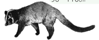
顔の真中に白いすじ

穴をふさぐ、屋根に登れるような庭木の枝を剪定(せんてい)するなどの対策をしましょう。