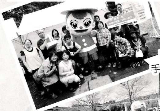
新宿区 手をつなぐ 親の会