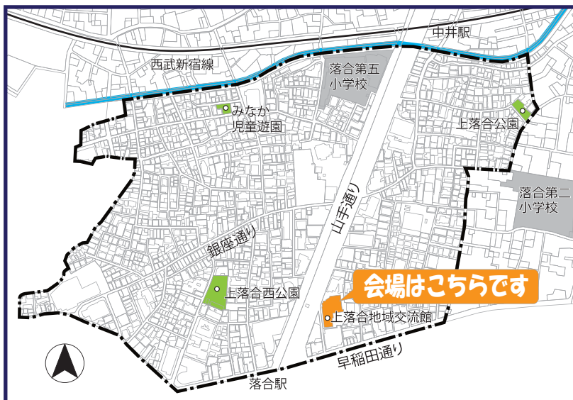
地区の範囲 （上落合二丁目（一部）・三丁目）