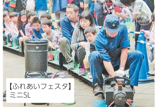
【ふれあいフェスタ】ミニSL