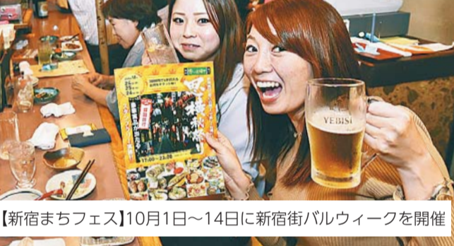
【新宿まちフェス】10月1日～14日に新宿街バルウィークを開催

新宿の秋を彩る「大新宿区まつり」を今年も区内各所で開催します。1面では新宿まちフェス、ふれあいフェスタの2つのメインイベントを、2面では町内会や商店街などが開催する31の協賛イベントを紹介します。