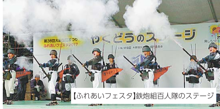
【ふれあいフェスタ】鉄炮組百人隊のステージ