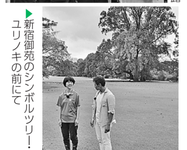
▶新宿御苑のシンボルツリ！ ユリノキの前にて