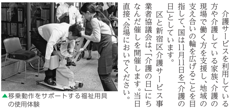
▲移乗動作をサポートする福祉用具の使用体験

介護サービスを利用している方や介護している家族、介護の現場で働く方を支援し、地域の支え合いの輪を広げることが目指して、国は11月11日を「介護の日」としています。