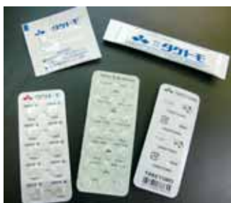
誰もが手にしたことがある医薬品パッケージ

「地球環境への負荷を減らすものづくりの信頼性を高めていくため、2011年にISO14001を取得しました。今後は医薬品包装の延長上に広がるコーティング技術を活かして、新たな市場にも挑戦していきたいと思えます」