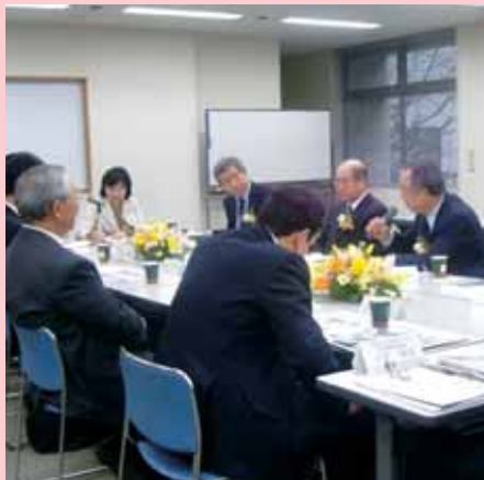
表彰式のあとは受賞企業代表者と区長による懇談会を行いました。