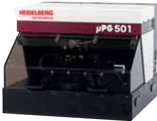
最先端のレーザー機器を扱うグローバル企業

「会社負担による教育制度、透明な基準による高水準の処遇、70歳までの雇用制など、常に雇用環境の整備を続けています。企業の成長を支えるのは従業員の成長。今後はそういう経営理念がグローバルスタンダードになるでしょう」