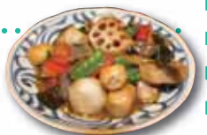
人気のニューの煮 根菜の仲良し

選んだ空き店舗は以前も飲食店でしたが、人の動線を考えて内装を一新。打ちっ放しの壁、白木のチェアと