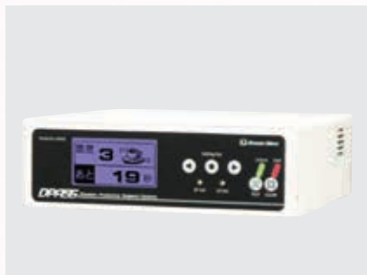
高度利用緊急地震速報を受信する専用端末「DPASS」

平成13年創業。当初は情報セキュリティの重要性にいち早く着眼し、ログデータを完全保存するサービス「Log Save(ログセーバー)」の販売を目指しました。しかし当時はまだその必要性への認知が低かったため、インテリア雑貨の輸入販売にも参入。狭小な空間でもワンタッチで設置できる雑貨収納ポールや、人間工学に基づき腰への負担を軽くした椅子は、経営基盤を支える商品に成長しています。その収益は「DPASS(高度利用者向け緊急速報専用受信機器)」の開発に投入されました。市場を的確に捉えるセンスと、中小企業ならではの小回りの利く経営で、優れた成果を上げている点が評価されました。