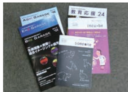
教育現場の先生・生徒向けの冊子も発行しています

だと思っています。考えるプロである研究者が必死でまとめた企画なら、実現に向けて検証する価値がきっとあるはずですから」（高橋社長）