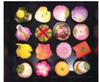
季節にちなんだ上生菓子。店頭でも目を引きます

美術大学を卒業後、平成6年から家業「神楽坂 梅花亭」に就業。平成25年に国家検定の「一級菓子製造技能」免許を取得した際には、上生菓子(練りきり)でも特に難しいとされる「はさみ菊」の技術が高く評価されました。花鳥風月を表すレパートリーは約200種。併設の厨房では6名の後進指導にも努めています。