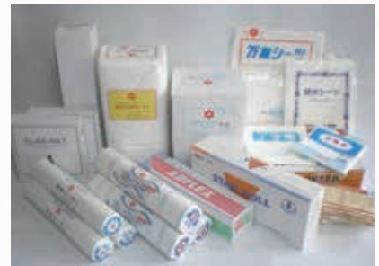
オリジナル商品のラインナップ

「経理業務を手伝っていたので、経営状況だけは把握していました。でも、その他のことはまったく分かりませんでしたので、現場を任せている社員たちに働きやすい環境を整えることが