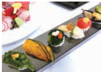
「ネタ」はすべて野菜でできている「野菜寿司」

昭和53年から日本料理の技法を京都で培い、平成21年より「ハイアットリージェンシー 東京」の和食料理長に就任。「すり流し」「蕪蒸し」などの料理を得意としています。レストランメニューに全国各地の郷土料理を取り入れ、和食の伝統継承にも尽力するほか、調理師専門学校の実習生指導や食品衛生指導にも貢献しています。