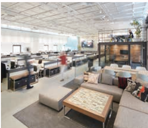
オフィスはそのままショールームにもなっています

先進的なオフィスデザインと店舗デザインの顧客満足度は高く、また東京本社オフィスをショールームとすることで市場の認知度が向上し、企業の成長につながり、経営革新賞に値する企業と評価されました。