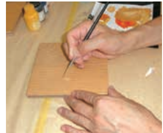
傷補修の仕上げに木目をていねいに書きこみます

平成13年、住宅メンテナンスサービスを提供する(株)バーンリペアに入社。住宅補修作業に従事し、同17年には補修スタッフリーダーに昇進。補修方法の開発にもあたり、後進の指導にも努めています。床や建具の破損修復を得意とし、補修箇所がまったく分からないような高い技術が評価されました。