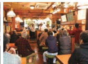
路上で、お店で、来街者もプレーヤーもいっしょに楽しめます!

【問合せ先】 新宿トラッドジャズフェスティバル実行委員会事務局 電話(3341)5009