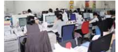
不動産広告に特化し、ハイスピード、ハイクオリティ、ローコストを実現