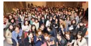
多くの女性が参加した「女子部JAPAN(こ)」のイベント

平成8年創業。出版物の企画制作からスタートし、現在は紙媒体だけでなく、WebやSNS関連コンテンツの企画制作、運営、企業へのマーケティング支援を行っています。 面白さやオシャレさだけでなく、その先にあるコミュニケーションを重視し、情報のみならず、発信者の想いを伝える媒体作りが得意。中でも女性に特化したコミュニケーションメディア「女子部JAPAN(こ)」は「部活型コミュニティ」を標榜し、Web上だけでなく、実際のイベントでも多くの参加者を集めています。これまで開催した女子会は100回以上を越えます。 そうしたコミュニティを活用したマーケティング支援事業は各方面から注目され、サンプリングの抽出や、実践的なマーケティングの戦略支援で独自性を発揮しています。常に時代のトレンドに沿った事業を展開し、創業以来、安定した黒字経営を継続している点が評価されました。