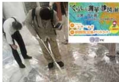
ICタグの技術を活用した地図のタイムマシン、時空ナビ。

「ICタグの活用は海外先で行でしたが、日本でもパレル業界が棚卸し作業の省力化に導入して勢いがつきました。今後はICタグの価格も下がり、普及が進みます」