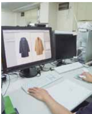
【写真右】高性能の機械を導入して、クライアントの要望に対応 【写真左】技術力を維持するため、社員教育に力を入れる

昭和50年創業。高度な表現力が要求されるカタログやパンフレットなどの商業美術印刷を行っています。デザイン部門だけでなく、印刷・製本設備を備えた自社工場を持ち、企画からデザイン、印刷まで一貫して行えるのが強み。優れたオペレーターが最新の色校正システムなどを駆使し、クライアントの要望に柔軟に対応することで、アパレル業界や美術館など、色彩や画像に高度な再現性を求める顧客から絶大な信頼を得ています。 技術力を維持するための社員教育に力を入れているほか、課題を社員全員で丁寧に解決していくことで全体のレベルを上げ、月単位の表彰制度などを経営基盤の強化につなげています。 「見る側」が求めているものは何か。顧客の要望を汲み取る力を磨いて積極提案型の営業を心がけ、高い印刷技術と制作力で、安定した収益性、生産性を維持している点が評価されました。