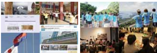
【写真右】島キャンやミートボールなど、新しい概念でマッチングを創出 【写真左】カンボジアをはじめ、アジアの人材にも着目

平成23年創業。主要事業の人材採用支援、特に新卒採用の分野ではコンセプトごとに複数のWebサイトを運営し、SNSを活用してユーザーとの相互コミュニケーションと情報拡散のスピードを向上させ、多数の学生の支持を獲得しています。