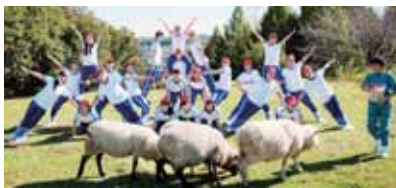
スタッフ一同、体操服を着て組体操

平成8年創業。出版物の企画制作からスタートし、現在は紙媒体だけでなく、WebやSNS関連コンテンツの企画制作、運営、企業へのマーケティング支援を行っています。 面白さやオシャレさだけでなく、その先にあるコミュニケーションを重視し、情報のみならず、発信者の想いを伝える媒体作りが得意。中でも女性に特化したコミュニケーションメディア「女子部JAPAN(こ)」は「部活型コミュニティ」を標榜し、Web上だけでなく、実際のイベントでも多くの参加者を集めています。これまで開催した女子会は100回以上を越えます。 そうしたコミュニティを活用したマーケティング支援事業は各方面から注目され、サンプリングの抽出や、実践的なマーケティングの戦略支援で独自性を発揮しています。常に時代のトレンドに沿った事業を展開し、創業以来、安定した黒字経営を継続している点が評価されました。