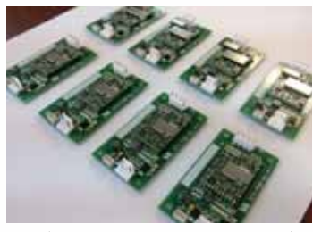
オリジナル製品の絶縁型DC/DCコンバータ。豊富なラインナップで顧客のニーズに対応

仕入先や外注先を営業所や子会社にし、設計開発試作から製造まで、社内で一貫して行える体制も整えました。