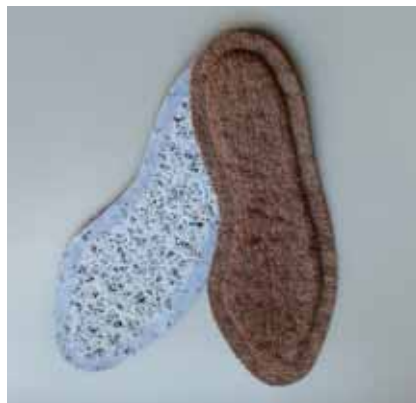
売れ筋のひとつ、インソール

もらえる製品を作れたかった。ユーザーからのハガキやメールの中に「他の洗濯物と一緒に洗うと部屋干ししてもにおわない」というご指摘があるなど、確かな手応えを感じています。ボロボロになつても消臭効果は残るので、クローゼットや靴の消臭剤としてリユースできます」 一般家庭向けでは靴下、インソール、クリーニングバッグ、タオルなどがよく売れているそうです。合成繊維の類似製品が多い中、100%コットンで肌に優しく、機能性、汎用性が高いことが魅力となり、海外からも注目されています。