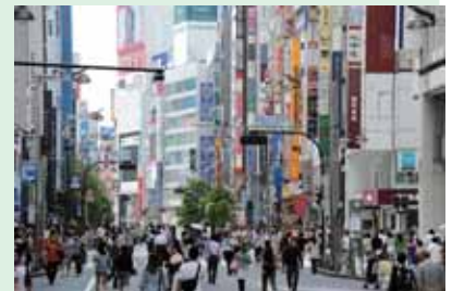
現在の新宿大通り