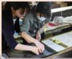
染色やふろしき包み、革小物を作る体験コーナーもあります！