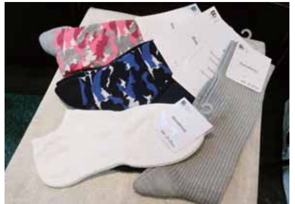
消臭効果は、家庭でも自衛隊でも実証済み

「おいがこもりやすい海上自衛隊の潜水艦でも顕著な効果が認められたのを機に介護業界で導入が進み、気象庁や国土交通