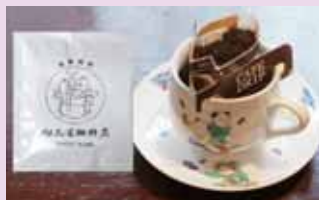
イチオシ商品のドリップコーヒードリッパー

販売の実施や訴求ポップの制作例は別資料として添付しました」 但馬屋のコーヒードリッパーは深煎りで10人中8人が苦いと答えるそうです。ですが、そうしたニッチな嗜好に注目してくれるバイヤーとの出会いに期待し、商談会にドリッパー器具を持ち込んでくれたのでコーヒードリッパーを頂きました。1件はその場で大筋の合意ができましたが、もう1件は売買契約まで数ヶ月を要しました。 「昭和信金の担当の方に相談に乗ってもらいながら、電話などのアプローチを続け、粘り強く交渉しました。先方の考え方をよく聞くことが大事だと思っています。飛び込み営業に比べて、成約率が高い商談会はとても魅力的。今後もぜひ参加したいと思えます」