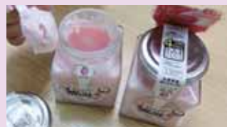
イチオシ商品の生せっけん「馬乳(メアミルク)」

私たちの役割は動機付けをして入口を作ることですが、商談会に同席し、どういう気持ちで商品を作っているかを知ることができ、その後の展開やフォローの一助となりました。今後も魅力的な商品や意欲を持つ企業に声をかけていこうと思います。(談)