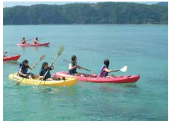
体験型の修学旅行も好評。沖縄の海で

また、同社が制作している情報紙『いい旅いい仲間』の発行部数は2万5千部で、うち約1万8千部がリピーターに発送されています。