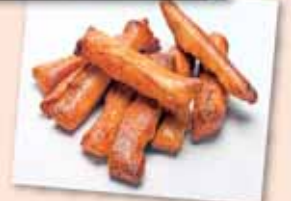
区内のお店による自慢の逸品販売があります！