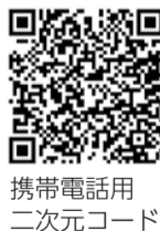
携帯電話用二次元コード