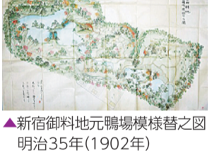
▲新宿御苑地元鴨場模様替之図 明治35年(1902年)

明治12年、宮内省管轄となった新宿御苑では、観桜会・観菊会等の皇室行事が行われました。宮内公文書館が所蔵する公文書等から新宿御苑の歴史を紹介します。 【日時】10月20日(土)~31年2月3日(日)午前9時30分~午後5時30分(入館は午後5時まで) ※10月22日(月)、11月12日(月)・26日(月)、12月10日(月)、12月25日(火)~31年1月3日(木)・15日(火)・28日(月)は休館します。 【費用】常設展観覧料300円(小中学生は100円。20名以上の団体は半額) 【主催】新宿区、新宿未来創造財団新宿歴史博物館、宮内庁宮内公文書館 【共催】区教育委員会 【会場・問合せ】新宿歴史博物館(四谷三栄町12-16) ☎(3359)2131・FAX(3359)5036へ。