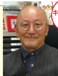
キーパーソンに聞く

チャリティーイベントでは、盲導犬の募金活動も行っています。私個人としては30年くらい前からやっているのですが、私が会長になった11年前からガラガラ抽選会当日に実施しています。過去10年で100万円を超える募金が集まりました。古本チャリティー販売の売上も合わせて寄付しています。また、募金活動を通じて、早稲田大学の学生が興味を持ってくださり、盲導犬育成トレーナーになった方もいます。長く続けると、そういった小さな物語が生まれるのも感慨深いですね。