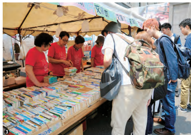
③1冊10円で販売された古本に学生たちは興味津々。購入数に応じてガラガラ抽選券がプレゼントされていた

期間中の5月17日・18日には早稲田大学南門近くの特設テント会場でチャリティーイベントが行われた。メインとなるのがガラガラ抽選会だ。商店会で使える金券1000円分のほか、地ビールやノート、商店会オリジナルタオル、お菓子の詰め合わせなどが当たる。抽選会場では、抽選器を回すガラガラという音や当選を知らせる鐘の音、そしてお客様の歓声が響き渡っていた。