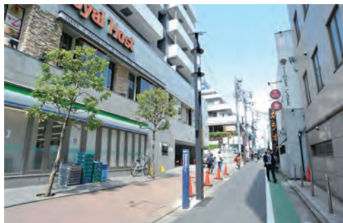
新たに街路灯もできた神楽坂仲通り商店会。こうした情報もいち早く、「新宿ルーペ」で紹介している

新宿区商店会連合会のホームページ「新宿ルーペ」。 神楽坂仲通り商店会では「新宿ルーペ」を活用した 商店や商店会の活性化に取り組んでいる。 その活動を密着取材した。