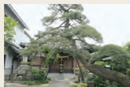
江戸時代、紀州新宮藩水野家ゆかりの寺だった瑞光寺

いつもは通り過ぎる商店街も、ちよこつと散歩で新たな発見。 江戸時代初期から幕末にかけての史跡が残る歴史の街。 個性的な飲食店が並び、散策の合間にぜひ立ち寄りたい。