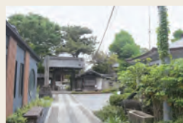
幸國寺の境内には加藤清正お手植えと伝わる大銀杏がある

いつもは通り過ぎる商店街も、ちよこつと散歩で新たな発見。 江戸時代初期から幕末にかけての史跡が残る歴史の街。 個性的な飲食店が並び、散策の合間にぜひ立ち寄りたい。