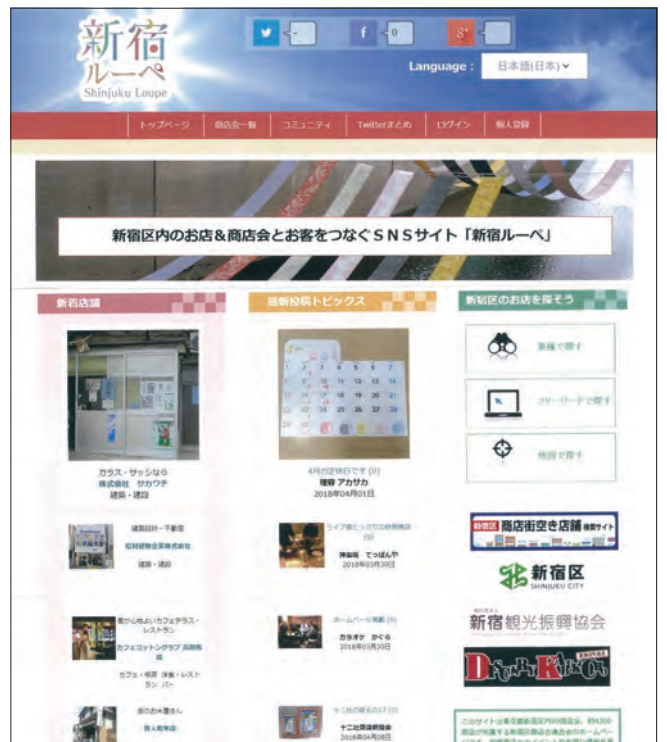
「新宿ルーペ」のトップページには、更新したばかりの「神楽坂 てっばんや」と「カラオケかぐら」が掲載されている