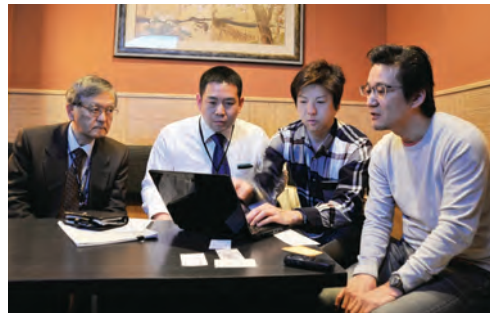
「カラオケかぐら」では、店主に話を聞きながら紹介画面を作り上げた

てもらい、それによってお客様が増えた、売上が増えたというような成功事例をつくるのができれば、他店にも広がっていくのではないかと思います。