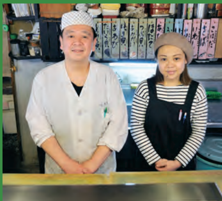
「女性が寿司を握るのも今では普通の光景になりました。何より華やかな雰囲気になります」と叔父は語る

【姪】もつと女性客が入りやすい店にしたいですね。常連客が大半なので、サラダを出したり、家庭の味を出したり、地元の人がかつるげる店にしていきたいですね。