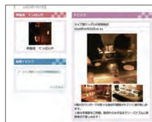
「神楽坂 てっばんや」のページ。「ライブ感たっぷりの鉄板焼店」というキャッチフレーズに興味をわく