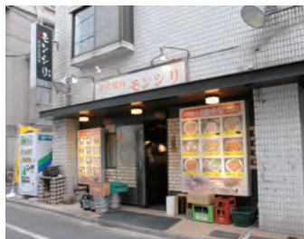
山本さんが子どもと一緒に来店したというボリューム満点で人気の「モンシリ」。

昭和51年(1976)、東京都新宿区生まれ。ドラマや映画、舞台などで活躍し、数々の賞を受賞する。2018年4月からはNHK-BS時代劇『鳴門秘帖』で主演(法月弦之丞役)を務める。