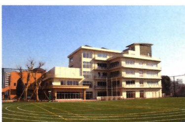
新宿西戸山中学校校舎

2020年には開校10周年を迎える本校に、さらなる支援の輪が広がるよう、いろいろな機会を捉え皆様をお願いしております。