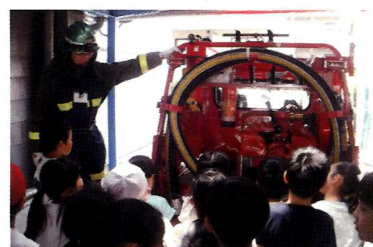
社会科での消防団の授業にて

温かいまなざしで常に児童を見守るその姿には、子育ての先輩として保護者からも慕われています。行事に携わるすべての人へ、自然に笑顔をもたらすその活躍に、今後も期待しております。