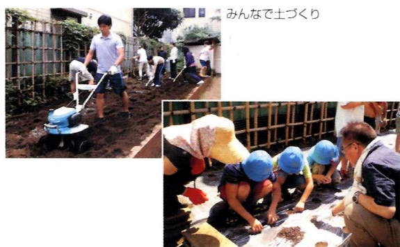
みんなで土づくり

学校とPTAと地域の連携役として活動しています。総合的な学習の時間での講師紹介、学校周辺の防犯・消防の施設・設備を調べる校外学習の付き添いや手伝い、PTA主催行事への地域参加依頼、他校スクール・コーディネーターとの情報交換や講師依頼などの相談など、戸塚第二小学校では特色ある学習として大根を小学校・幼稚園の児童一人ひとりが一本ずつ育て収穫するということがあります。4月に先生たちと相談し、6月に先生や地域の方で畑を耕し肥料を与え、8月に畝を作り、9月に一人ひとり種をまき、自分で観察し育て、12月に収穫し家に持ち帰り料理します。後で作ったものを図入りで報告してくれる学年もあります。今年も300本の大根を全校児童で作ります。