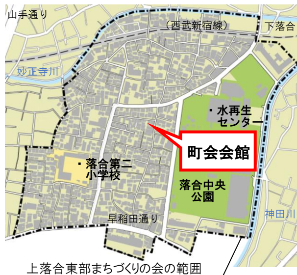
上落合東部まちづくりの会の範囲