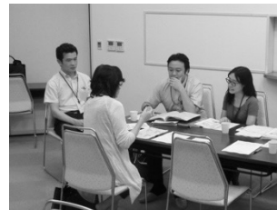
個別相談会の様子