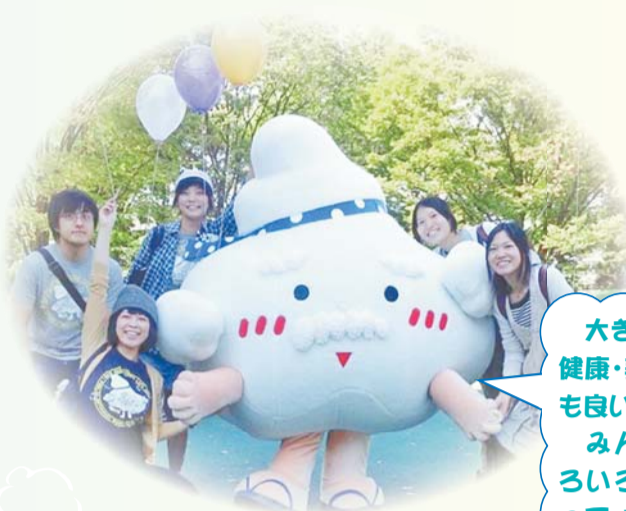
新宿浴場組合公式キャラクター「ゆげじい」

【問合せ】地域コミュニティ課管理係(本庁舎1階)☎(5273)3519・〆(3209)7455へ。