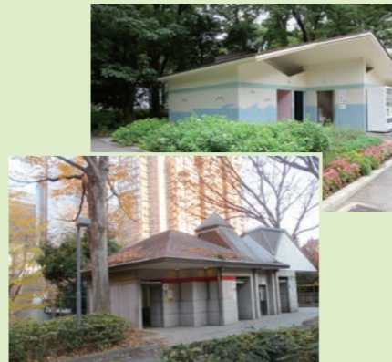
園内の主なトイレ

公園のトイレにネーミングライツを導入し、施設のイメージアップと維持管理のレベルアップを目指します。