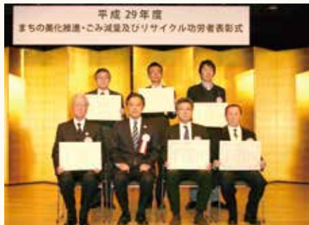
まちの美化推進の部

平成30年1月26日(金)、新宿文化センターにて、まちの環境美化推進に多大な功労のあった団体、資源の集団回収を通じてごみ減量とリサイクルの推進に功労のあった個人や団体、事業活動の中でごみ減量とリサイクルの推進に優れた取り組みをしている事業者を表彰しました。