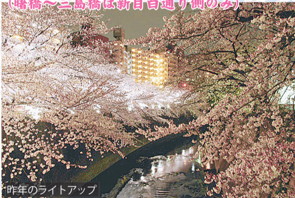
昨年のライトアップ