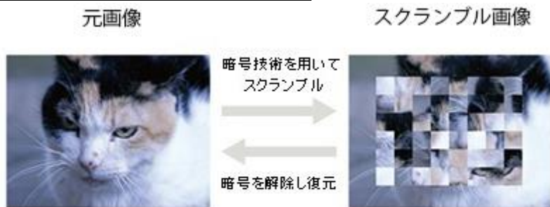
スクランブル画像の生成及び復元のイメージ