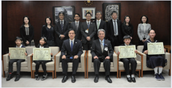
▲区長賞表彰式を開催