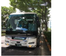
先駆的企業バスツアー