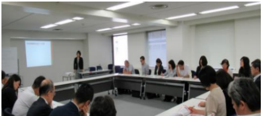
企業支援セミナーの様子