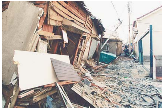
▲阪神淡路大震災での家屋倒壊の様子

毎年1月15日～21日は、災害時のボランティアや自主的な防災活動、災害への備えを考える「防災とボランティア週間」です。この機会に自分や大切な人を守るためにできることを考えてみませんか。