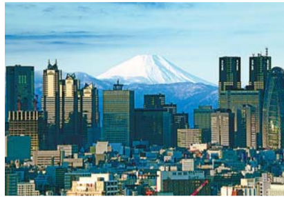
西新宿の高層ビル群と富士山

1月 1日 歳旦祭=葛谷御霊神社。1日か 5日 新宿山の手七福神詣で○毘沙門天=善國寺 ○大黒天=経王寺○福祿寿=永福寺○弁財天 =巖嶋神社○寿老人=法善寺○恵比寿=稲荷 鬼王神社○布袋尊=太宗寺。干支祈願=稲荷 鬼王神社。七福神まつり=成子天神社。 5日 初弁天祭=巖嶋神社。 8日 湯花神事=花園神 社。成人の日「はたちのつどい」=京王プラ ザホテル○総務課総務係。 13日 おびしゃ祭 =葛谷御霊神社、中井御霊神社。 15日・16日 エ ンマ大王開帳=太宗寺。 20日 防災と ボランティア週間講演会=四谷区民ホール○危 機管理課地域防災係。 21日 牛込笹笥 地域まつり○牛込笹笥地域センター。 28日 円 空仏公開(毎月28日午後)=中井出世 不動堂○文化観光課文化資源係。新宿シ ティハーフマラソン・区民健康マラソン○新 宿未来創造財団