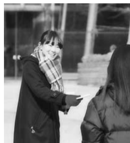
▲販促物配布の様子

また、教育の行き届いたスタッフによる販促物の配布実績や反響結果が顧客から好評を得ています。