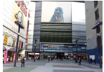
シネシティ広場 整備後

このような周辺環境の変化に続き、一番街地区においても、歌舞伎町のメインストリートとしての更なる発展と、安全・安心なまちづくり等を目指し、皆さまとより具体的な議論を重ねるため、協議会を発足させることとなりました。より持続的な賑わいづくりのため、活発な意見交換ができたらと思っています。ご多忙とは存じますが、皆さまの御参加をお願い申し上げます。