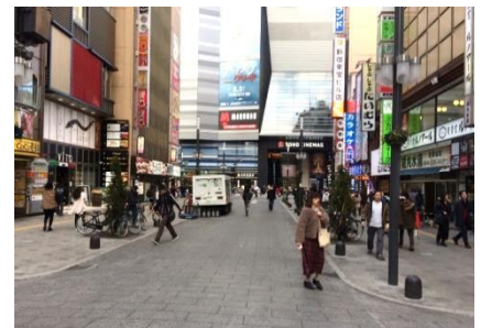
セントラルロード 整備後