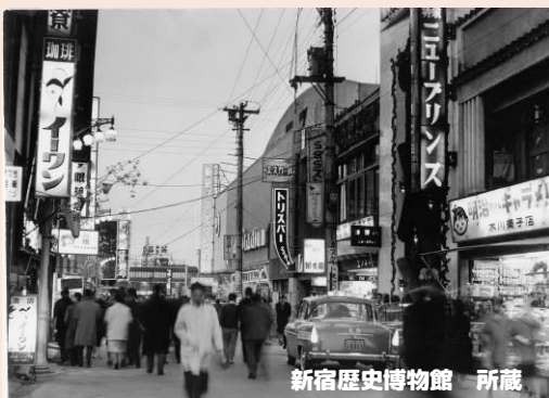
昭和 33 年頃の一歩街の様子

大空襲で焼け野原となった歌舞伎町は、戦災復興土地区画整理によって瓦礫の上に新しい都市空間を計画し「歌舞伎の演舞場を建設し、これを中核として芸能施設を集め、新東京の最も健全な家庭センターを建設する」ことをコンセプトに『歌舞伎町』と命名されました。不幸にも歌舞伎劇場の誘致は実現しませんでした。現在では日本屈指の繁華街として、世界中から多くの人々が訪れるまちとなっています。(歌舞伎町街並みガイドラインより一部抜粋)