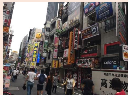
現在の一歩街の様子