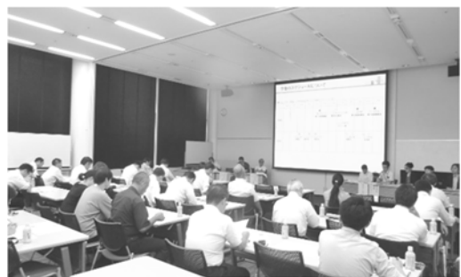
第7回まちづくり協議会の様子

※このお知らせは、西新宿一丁目商店街地区の今後のまちづくりを皆様と考えるためのお知らせです。現在、まちづくりのルール等について検討中であり、決定してものではありません。