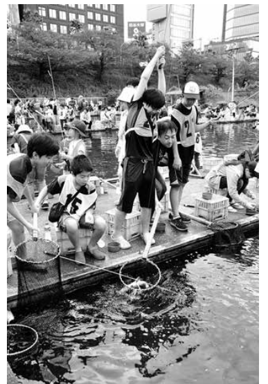
主催 早稲田地区青少年育成委員会