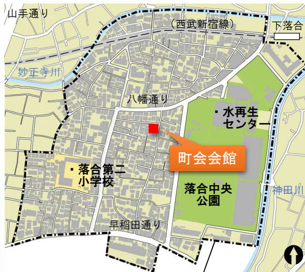
上落合東部まちづくりの会の範囲