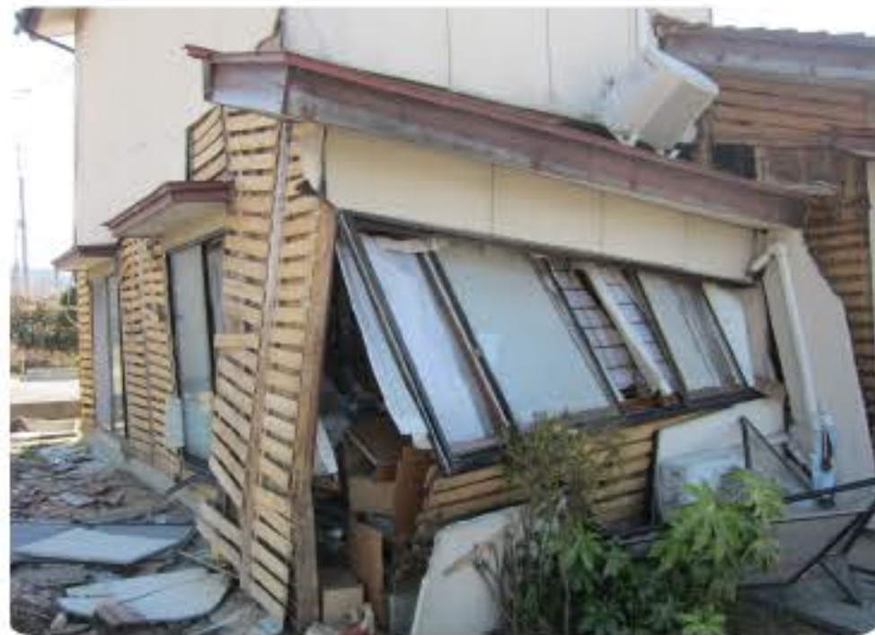
東日本大震災で被災した住宅

新宿区地震ハザードマップには、「急傾斜地崩壊危険区域・箇所」、「液状化の可能性がある地域」、「土砂災害警戒区域・土砂災害特別警戒区域」及び「地震に関する地域危険度測定調査結果（第7回・東京都発表）」などのまちの状況を掲載しています。