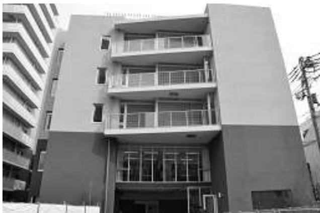
(入所支援施設「シャロームみなみ風」)

介護・福祉サービスのサービス供給体制の整備促進 地域福祉活動への支援、コーディネート 障害のある人とその家族への相談体制の充実 関係機関などとの連携強化 地域見守りネットワークの充実