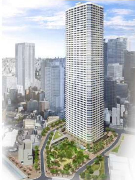
(西新宿五丁目中央北地区市街地再開発事業完成予想図)