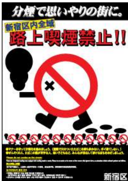
(路上喫煙禁止ポスター)