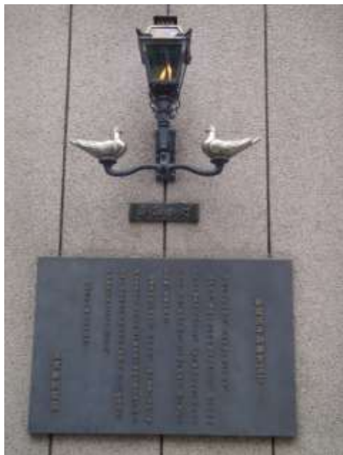
(平和の灯・平和都市宣言版)