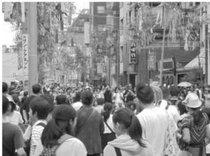
(薬王寺・柳町連合 七夕祭)

多様な主体との連携促進や支援 観光案内制度の整備 観光情報の発信、観光資源情報などの環境整備 商店街への支援