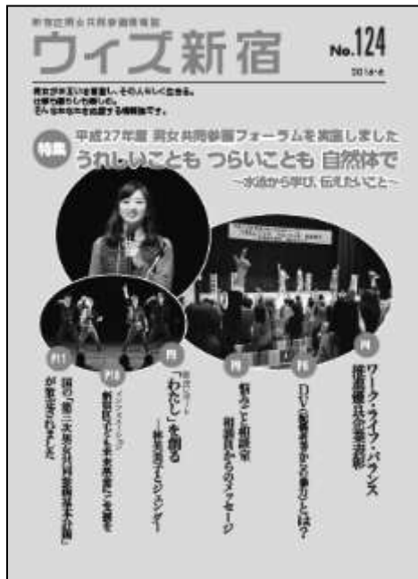
（男女共同参画情報誌）