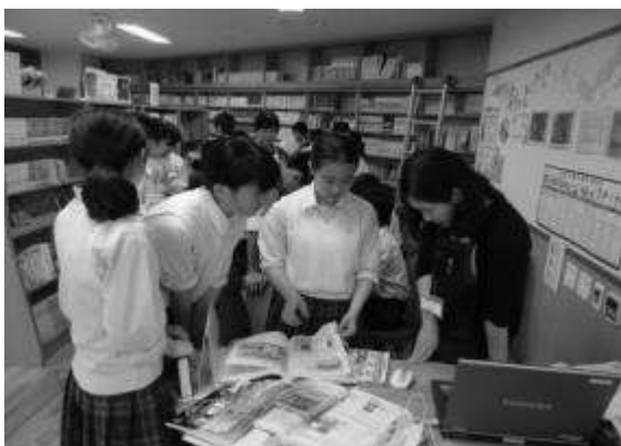
(学校図書館の活用)