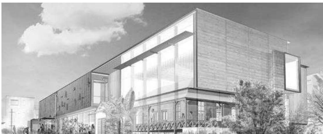
(漱石山房記念館 完成予想パース)

文化・芸術に関する活動の支援と情報の発信 歴史や伝統文化の保存と継承の支援 観光案内制度の整備 観光情報の発信、観光資源情報などの環境整備 観光バス駐車場の整備促進