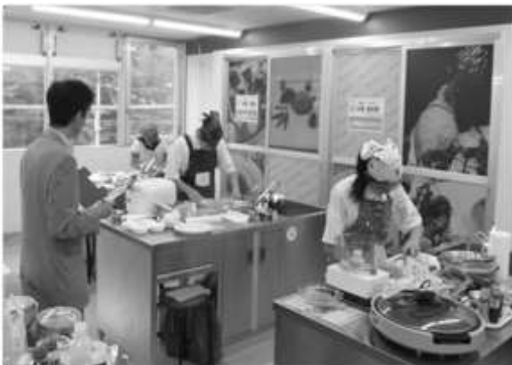
(メニューコンクール)