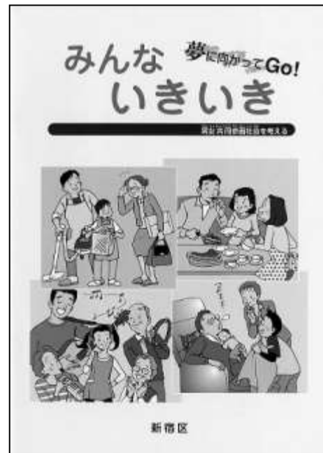
（小学校高学年向け男女共同参画啓発誌）