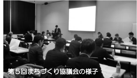
第5回まちづくり協議会の様子

「まちの将来像」について、地区の皆様と共有するため、アンケート調査の実施について報告を行いました。