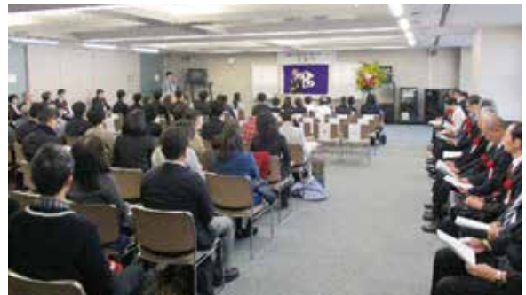
▲保護者の皆様や教職員などたくさんの方々にお越しいただきました

区立図書館では、図書館利用の促進と調べる学習の普及、児童・生徒の自己解決能力の育成や生涯を通じて学ぶ力を育てることを目的に「新宿区立図書館を使った調べる学習コンクール」を開催しています。今年度もたくさんのご応募をいただきありがとうございました。応募作品の中から各賞を決定し、平成28年11月13日(日)に表彰式を行いました。また、館長賞、優秀賞の作品は全国コンクールへ推薦しました。過去の作品集は区立図書館に所蔵しています。受賞された皆さん、おめでとうございます。