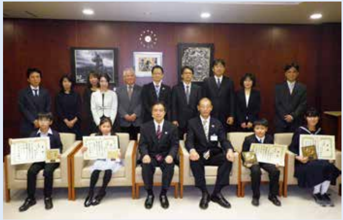
▲平成28年12月15日に区長賞の表彰式を開催