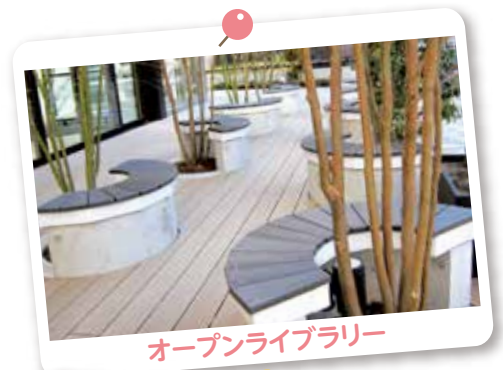
オープンライブラリー

※中央図書館のDVDも、平成29年度の中央図書館特別図書整理期間後(秋頃の予定)より同様の方法で貸出します。なお、四谷図書館のDVDはこれまでどおりケースに入れて書架に置きます。