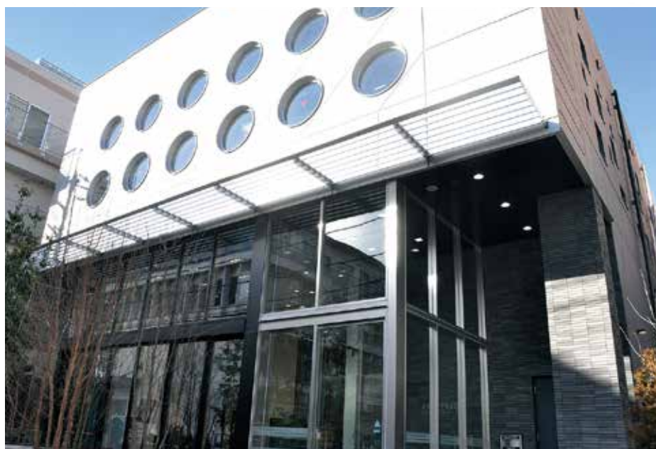
▲下落合図書館の外観

3月11日(土)、旧中央図書館跡地(下落合1-9-8)に下落合図書館がオープンします。中央図書館が41年もの長きにわたり多くの方に利用されたこの地で、皆様に親しまれる新しい地域図書館を目指していきます。下落合図書館の詳細については2面をご覧ください。