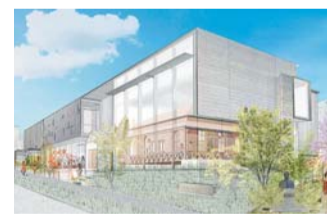
9月に開館する漱石山房記念館